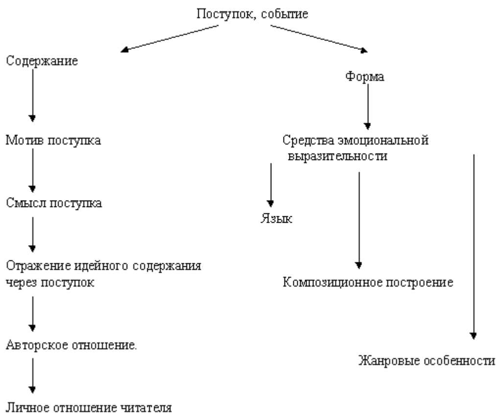
СХЕМА АНАЛИЗА ПОСТУПКА ПЕРСОНАЖА